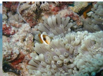
ギリ・メノ周辺の海の中

今回は改めてのギリ・メノの紹介となりました。日本から訪問される方には若い方が圧倒的に多いのですが、欧米は年配の方々の滞在も結構多いので、その辺の違いを少し分析したいと思います。