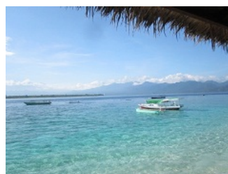
ギリ・メノの海岸からギリ・アイルおよびロンボク本島を望む