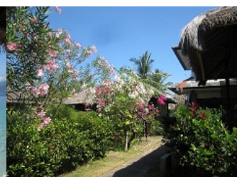
花に囲まれている Casablanca のコテージ

★マリーナ・スポーツが満喫できるギリ・メノ & Casablanca にぜひお越しください★