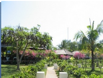
ギリ・メノにあるホテル Casablanca 風景