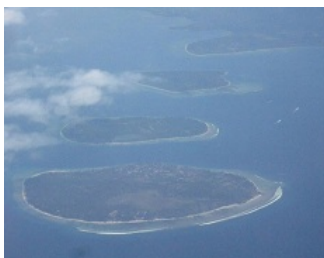
ギリ 3 島(手前からギリ・トラワンガン、ギリ・メノ、ギリ・アイルの 3 島)

また、マリーナ・スポーツがお好きな方には、ダイビング、シュノーケリング、サーフィン、フィッシングなど、一日の時間が経つのが早過ぎるくらいに感じると思えます。