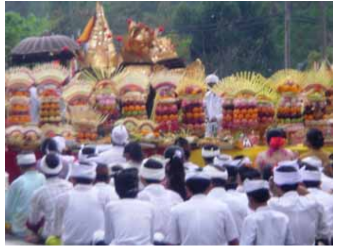
州道を通行止めされた車の中から祭の様子を撮影

バリ島には3,000に及ぶお寺があるといわれています。満月や新月、その他数多くのお祭りが行われています。なかでも各々のお寺の創立記念のお祭りは計算上年3,000回あるといえ、毎日どこかの村でお祭りがあるといっても過言ではありません。とにかくお祭り最優先ですから、ケアリゾートバリへ向かう一番大きな州道もご覧のように堂々と通行止め、誰も文句を言えま