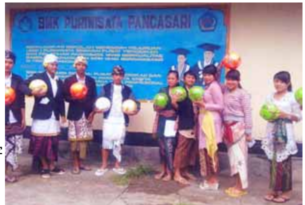
うれしそうにサッカーボールを手にする生徒達

村の人達に役立ててもらうための「ゆう会基金」を創設して下さった方々が、昨年村の学校にサッカーボールと日本語の辞書を贈呈して下さいました。そのお礼として、写真と日本語のお礼状が届きました。学校で日本語を習っているので、平仮名で書いてくれています。今度は日本語の辞書があるので、辞書をひきながら、ぜひ漢字にも挑戦してほしいものです。