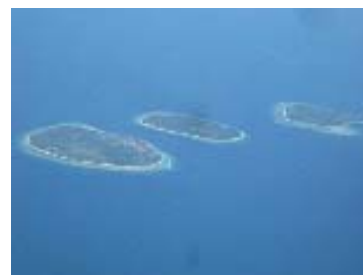
ロンボクの海のリゾート。ギリ3島中央がギリ・メノ