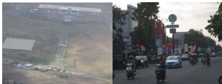
ロンボク国際空港前の整備された道路

インドネシアでは、交通手段はほとんどが車やバイクなので、ジャカルタやスラバヤの大都市では道が大渋滞で移動するのが大変です。最近バリでも結構渋滞が多いのですが、それに比べてロンボクは交通量も少なく、移動するにも道は整備されてとても快適です。ただし、バイクが非常に多く、無謀な運転するバイクもあり、車の運転時には注意が必要です。