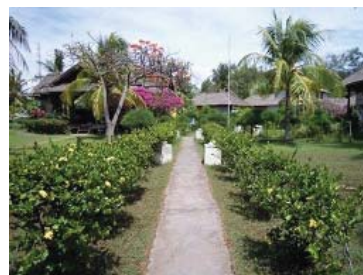
ギリ・メノにある Casablanca ホテル風景