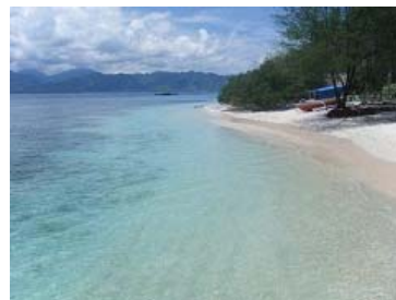
Casablanca から1、2分歩くとギリ・メノ海岸に出る