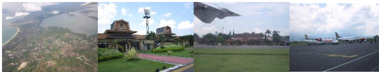
空から見たデンパサール空港。 左上が滑走路

この国内線航空券はインターネットを利用して日本でも購入出来ますので、大変便利になりました。