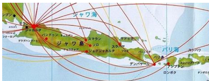
インドネシア・ジャワ島、バリ島、ロンボク島の位置関係

もう一つは朝早く羽田からのシンガポール航空でシンガポール・チャンギ空港へ行き、シンガポール航空子会社のシルク航空で夜にロンボク・マタラム空港に行く方法です。