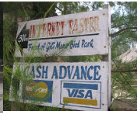
Bird Park への 案内板