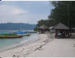
Bird Park へ 入る道付近