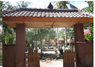
Bird Park の 入口門

GILI MENO BIRD PARK の規模は、島の大きさからも想像出来るように、こじんまりとしており、長くても 30 分程あれば十分に見られる規模です。でも園内に入ったすぐの籠の中におしゃべりをする白いオウムがいて、結構長い時間楽しませてくれると思います。鳥の種類はもちろんインドネシア地域を中心にしてはいますが、同じ熱帯地域の南米の鳥も多くなります。ギリ・メノにお越しの際はぜひご訪問ください。