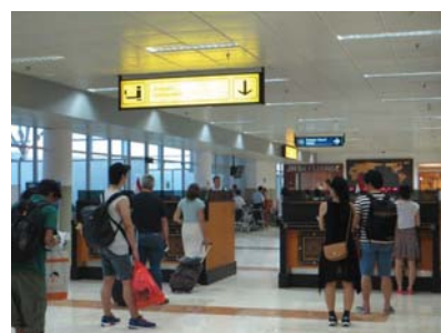
ロンボク国際空港内の 国際線出国検査窓口