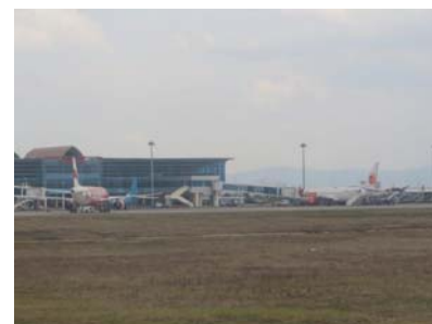
ロンボク国際空港の駐機する エア・アジア及びライオンの航空機