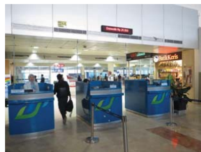
ロンボク国際空港内の 空港使用料支払い窓口 国際 Rp150,000、国内 Rp25,000