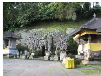
ウブドにある有名なゴア・ガジャ石窟