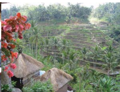
テガラランの棚田風景

を行きましたが、最初はデンパサール近郊でバリダンス観賞、次にウブド北のテガラランにある棚田見学、その後は更に北のバリ高原にあるキンタマーニ村のレストランで、活火山バトゥール山やカルデラ湖を眺めながらインドネシア料理バイキング昼食。