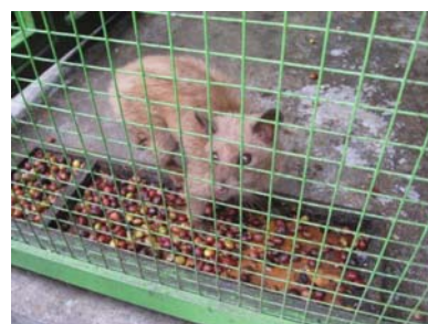
ジャコウネコのルアックが食べ糞として未消化で出て来たコーヒー豆を洗浄・乾燥・焙煎し、最高のコーヒーを作る