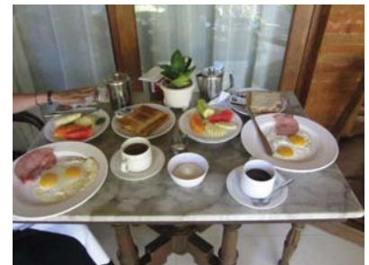
たまにはホテルの 部屋テラスでの朝食

こんな個別ステイへの詳細な計画を立てる必要はありませんが、滞在期間を決め、ネットで往復航空券予約、泊まりたいホテルやアパートメント等の予約は少し前もって検討が必要です。