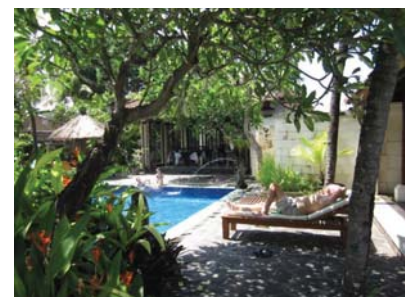
日差しの強い日中は ホテルのプールサイドで寛ぐのも最高！

http://www.h2.dion.ne.jp/~gilimeno/ Casablanca への お問い合わせは、 shimaint@r4.dion.ne.jp へ