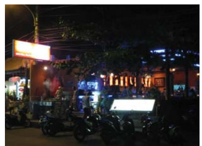
夜は通りのレストランでデイナー サヌール通りの BBQ レストラン El Comedor シーフードが美味しい