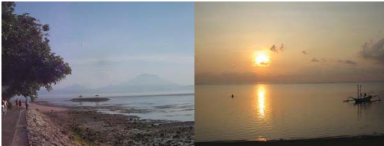
朝のサヌール海岸 ウォーキングやジョギングを楽しむ風景 遠くにアグン山を望む

バリの海岸に隣接するホテルに長期滞在し、早朝に海岸をジョギングや散歩で汗を流し、シャワー後、ホテル朝食バイキングをゆっくり楽しむ。その後は海岸の木陰等の寝椅子でゆっくりし、読書をしたり、海を眺めたり、またホテル・プールサイドの寝椅子でゆっくりし、好きな飲み物を飲みながら読書をしたり、プールで泳いだりする。その後、何時もより遅めの昼食を海岸やホテル・プールサイドで食べ、夕暮れまで時を忘れてゆっくりする。夜は徒歩でホテル近くのレストランが並ぶ通りに出掛け、その日食べたい料理があるレストランに入り、星空の下のテーブルで好きな飲み物を飲み、好きな料理をじっくり堪能する。