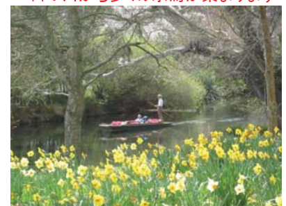
エイボン川でのパンティング風景 今の時期、川辺の水仙がきれい

この植物園の正面入口付近にカンタベリー博物館があります。2年前の地震の影響を殆ど受けなかった19世紀後半に建てられたネオ・ゴシック建造物の中に、カンタベリー地区や CHC の歴史、南極探検の歴史や標本、かつてNZに生息した巨鳥モアや国鳥キーウィの剥製等が展示されていて、非常に見ごたえがあります。CHC へ訪問の際は、是非ゆっくりと時間を掛けてご覧願います。