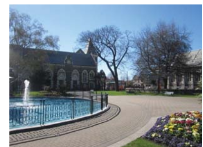
CHC 植物園の噴水付近から 左にカンタベリー博物館 右にアート・センターを見る

http://www.h2.dion.ne.jp/~gilimeno/ Casablanca のお問い合わせは、 shimaint@r4.dion.ne.jp へ