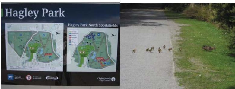
ハグレー公園内案内板

また、この公園の廻りには周回する緑に囲まれたウォーキング・コースもあり、多くの人達が歩いています。CHC ロングステイの時は、毎日時間を決めて公園に行き、1時間程度のウォーキングもとてもお勧めです。